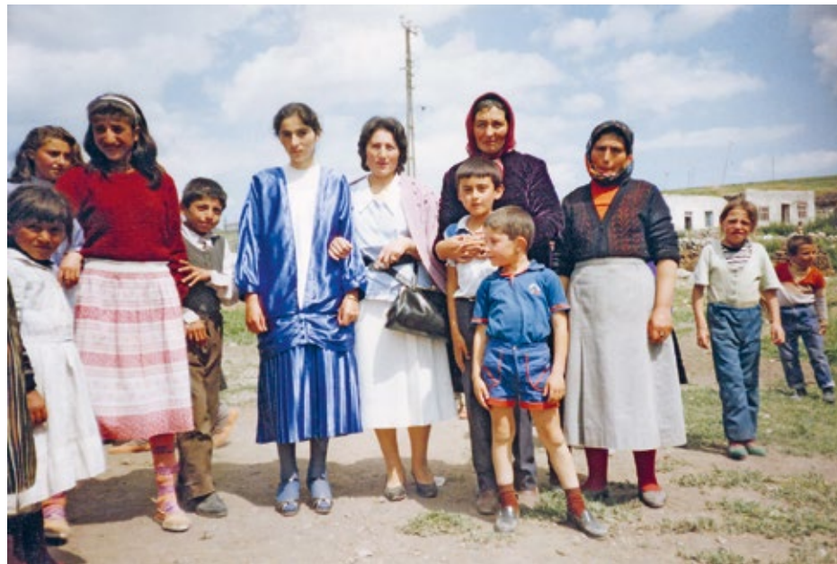
at her engagement ceremony 1987